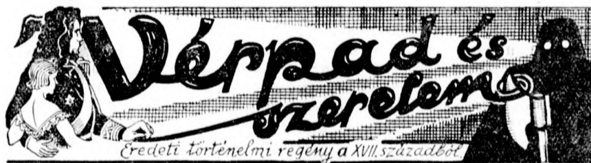
Eredeti történelmi regény a XVII. századból