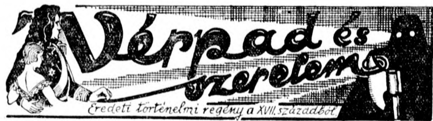
Eredeti történelmi regény a XVIII. századból