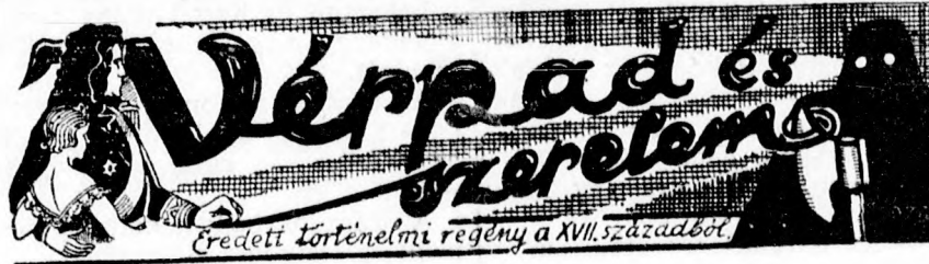
Eredeti történelmi regény a XVII. századból

— Csak akkor teheti meg, ha előbb kétfelé hasít! — nevetett a fiatal hadnagy és Berzeviczyt el-sietett.