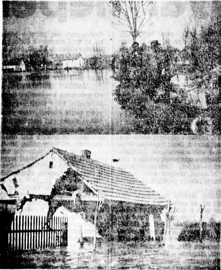
FELSŐ KÉPÜNK A SUMSZKA-UCCÁBAN VÉGZETT TÖLTÉSHÁNYÁSI MUNKÁLATOT ABRÁZOLJA. EZT A KIS TÖLTÉST AZÓTA MÁR ELVITTE AZ ÁR. — ALSÓ KÉPÜNK A BÁCSKA-UCCA EGYIK BEOMLOTT HÁZÁT MUTATJA

Lehet, hogy ilyen terv valóban felmerült, de az már a múlté. Ugyanis időközben a víz valóban áttörte a szombori vasutvonalat.