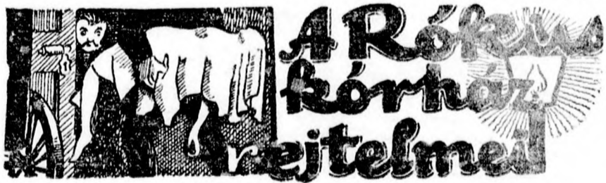
Izgalmas történet a száz év előtti Budapest mélységeiből

— Szerezni akarsz nekik! Eszedbe se jusson! Merit égetné az asztalt, még ha úgy vennéd is. Nem tudná viselni... a te kezéből. Látod, az apa kezéből!