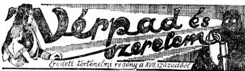
Eredeti történelmi regény a XVII. századból

Bercsényi elősietett a homályos sarokból s szó nélkül megölelte a fejedelemet.