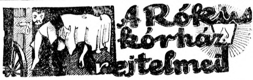
Izgalmas történet a száz év előtti Budapest mélységeiből

— Makkacs egy fickó az, nagyságos asszonyom. Ahelyett, hogy megtörne, fenyegetésekkel kel ki ellenem és ön ellen is.