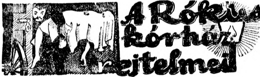
Izgalmas történet a száz év előtti Budapest mélységeiből

A szünni nem akaró tapsvihar következtében a fiuak még egyszer meg kellett jelennie a közönség előtt.