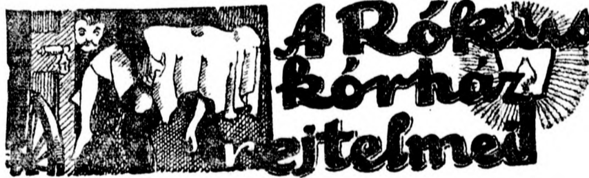
lagalmas történet a száz év előtti Budapest mélységeiből

— Doktor Rác Ferenc. — Hogyan?... — Mit akarsz? — Még egyszer... a... nevével!... — Doktor Rác Ferenc. — Magas te metű, szöke fiatal ember? — Az. — Kráglfi fia! — Kié? — Kráglfié. Nem szabad meggyilkoltatnod! — S miért ne? — Pista! — El van intézve. Ezen nem lehet változtatni. — Dehogya is nem, Pista. Igenis, meg kell változtatnod elhatározásodat. Hogy én a szegény Kráglfi fiát megöljem! Ki hallott már ilyet! — Valóban azt kell hinnem, hogy meghígult az eszed. — Dehogya. De lásd, az öreg Riskó évtizedeken át a leghűbb cimborá volt, a tűzbe ment volna bármelyikünkért, ebben is veszett el. Megérdemli tőlünk, hogy a fia életét megkíméljük. — Holnap este a helyeden lesz! A többire nem vagyok kíváncsi. — Nem, nem veszek részt ebben a dologban. — Igenis, részt fogsz venni! — Ha nem határozol másként, megtartom az engedelmességet! — Ne bűszíts fel, Praček! E'ég volt a fecesgéből. Ha vonakodol, fiad veszve van! A portás a karosszékbé hanyatlott.