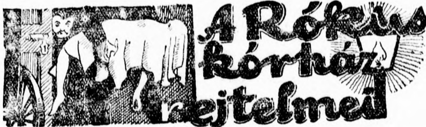
Izgalmas történet a száz év előtti Budapest mélységeiből

— Itt kell lennie a házban, — tombolt a báró veszett haragjával.