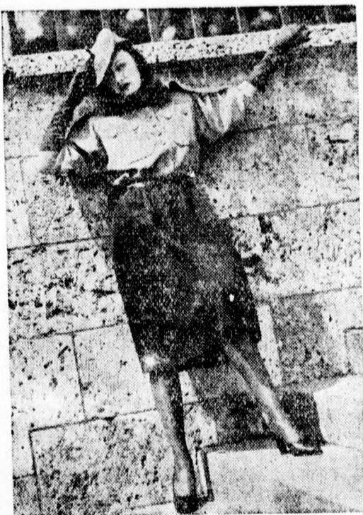
KÖRÖM-É- BLUZ, ZÖLD SZOKNYÁVAL, SPORTSAPKÁVAL ÉS RÁVARRT SÁLLAL

kezekben maradt, de intézményi voltát elveszítette. Működése azonban a vezetőség azonosságára révén maig megszakítás nélkül.