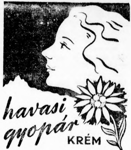
SZEPLŐ PATTANÁS ELLEN — KITŰNŐ ARCÁPOLÓ ZSIROS BÖRRE — KÁMFOROS HAVASI GYOPÁR-KRÉM

Kazinczi, Solyom, Klapka, Bangha Béla, Hargita, Délibáb, Bercsényi Dániel, Tüzér, Szegő József, Csikós, Pásztor, Ferenc, Kórház, Csaba, Csánádi, József, Pirosi, Balázs Árpád, Erkel Ferenc, Benczur, Gyulai Pál, Hortobágyi, Kárpát, Juhász, Gulyás,