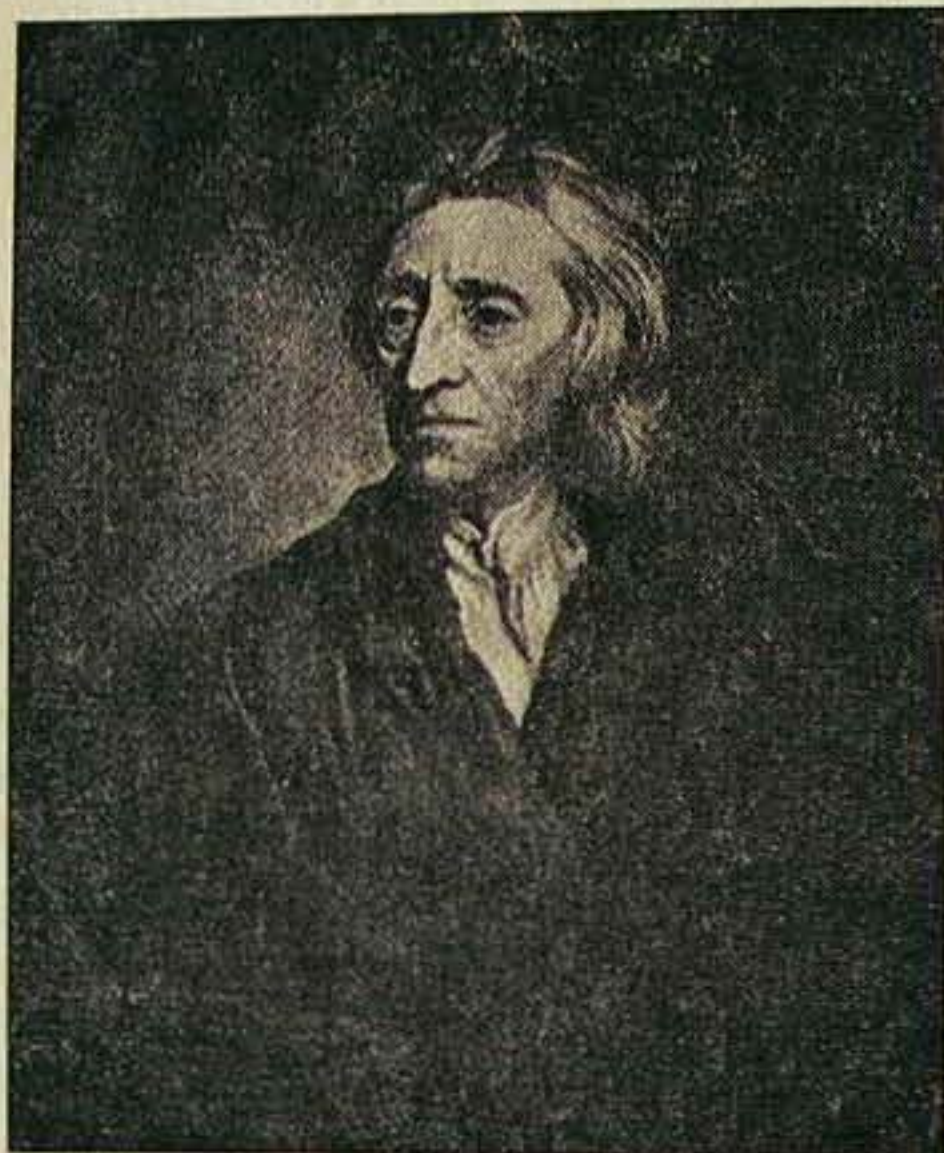
John Locke portréja, — a kép eredetije a leningrádi Ermitázs múzeumban van.

Ebben az esztendőben van kétszáz éve annak, hogy 1774. ápr. 17-én Theophilus Lindsey megnyitotta az első unitárius templomot London ismert főutcájáról, a Strandról a Temze folyó felé nyíló Essex utcában. Ezen a helyen áll ma a nagy-britanniai unitáriusok központi székháza. Lindsey szabadelvű nézetei miatt vált ki az anglikán államegyházból. Első nyilvános unitárius istentiszteletén mintegy kétszáz hallgató volt jelen, köztük sok az anglikán államegyháztól elszakadt lelkész, az angol főnemesi rend egyik tagja és a közismert