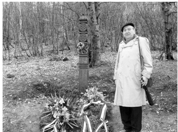
Főszerkesztőnk koszorúzás után a kopjafájánál