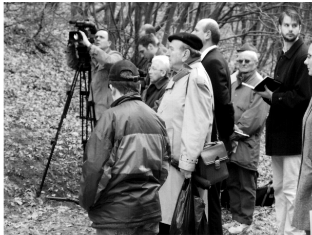
A megemlékezés résztvevőinek egy csoportja

Nagyon szép, felemelő és emlékezetes megemlékezés volt. Az ünnepélyen mintegy 80-100 fő jelent meg. Többen az elhunytak Franciaországban élő rokonai és leszármazottai. Remélhetőleg a következőkben évről-évre növekedni fog a megemlékezők száma és a