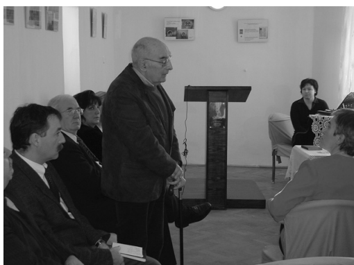
Szinte Gábor festőművész