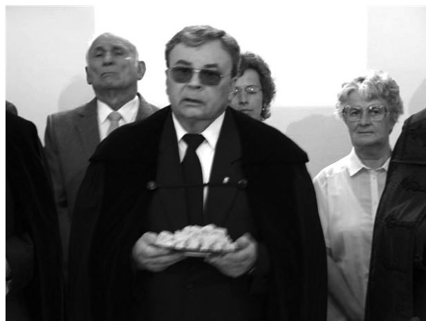
Rázmány Csaba püspök