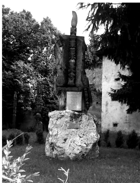
A nagyajtai emlékmű