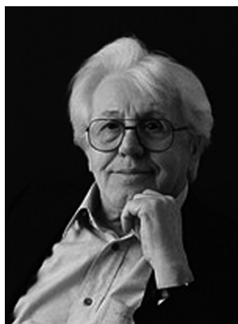
Sütő András 1927–2006

„Engedjétek hozzám jönni a szavakat” „Engedjétek hozzám jönni önmagamat.”