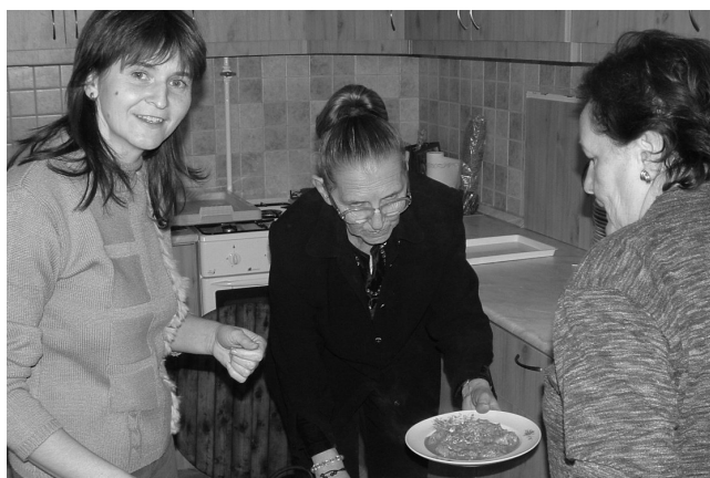
Munka a megújult konyhában

Az utóbbi néhány évben kívül-belül megújult a pestszentlőrinci Havanna-lakótelepi, az idén 70 éves