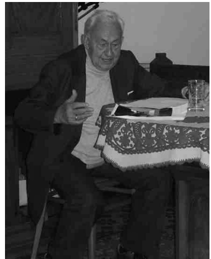
A szerző előadás közben

Gondolom, e személyes példa másokat is arra ösztönöz, hogy elgondolkozzanak azon: az én életemben is vannak megmagyarázhatatlan szabadulások, melyekre sokszor azt mondjuk: csoda, vagy csodával határos, de tulajdonképpen transzcendens erők működéséről van szó. Nálam mindenesetre ez a csodának tűnő eset vallásos hitem erősödéséhez vezetett. El-