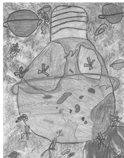
Ampulle: A villanykörte alakú Föld

Már a 18. században Lomonoszov orosz és Lavoisier francia tudósok bebizonyították az anyag-, majd a 19. században Mayer német orvosfizikus az energia-megmaradás törvényét, amely szerint az anyag és az energia elpusztíthatatlan. Ezt az ökológiában úgy fejezik ki, hogy a természet nem ismer hulladékot, mert ami az egyik élőlény számára