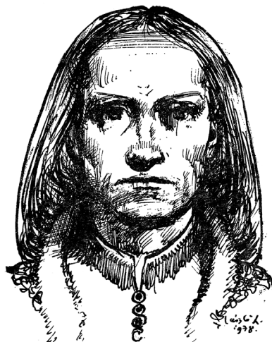
László Gyula rajza Dávid Ferencről

nekem adatott erő szerint. Dávid Ferenc jézusi lelkületét arról az oldalról szeretném megközelíteni, melyen ő is a megegyezés és nem a megalkuvás készségével vitázott ellenfeleivel. Tanulmányaimból tudom, hogy a második kérdésre, a megalkuvás elutasítására mindenki felfigyelt a Dávid Ferenc hitvitáiról fennmaradt feljegyzésekből. A Melancthon-i megegyezés hajlandóságát szerintem ez nem zárja ki úgy, ahogy Dávid Ferencet kizárták maguk közül azok, akik nem voltak hajlandók vele a megegyezésre.