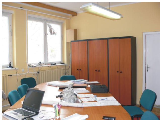
Az önkormányzat tárgyalója új helyre került