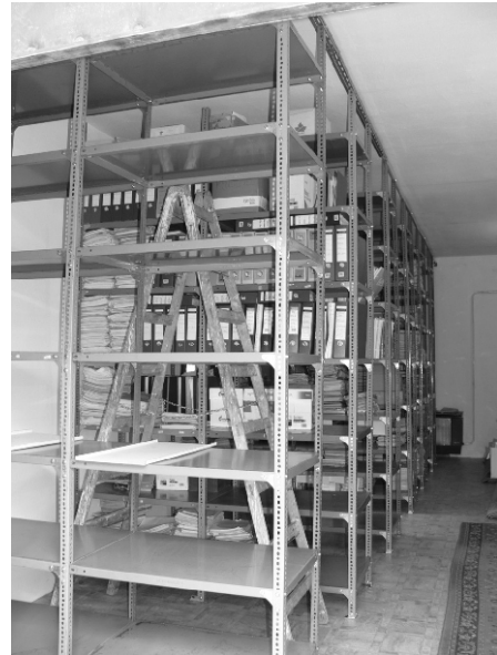
Az új irattár