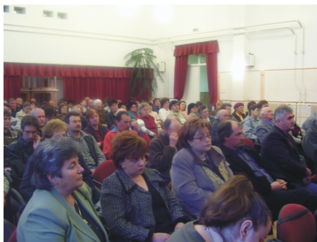
Falugyűlés március 29-én