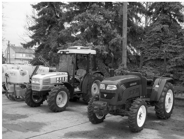
Barackvirág napok március 29-én

A könyvtár május 7–31-ig leltár miatt ZÁRVA tart!