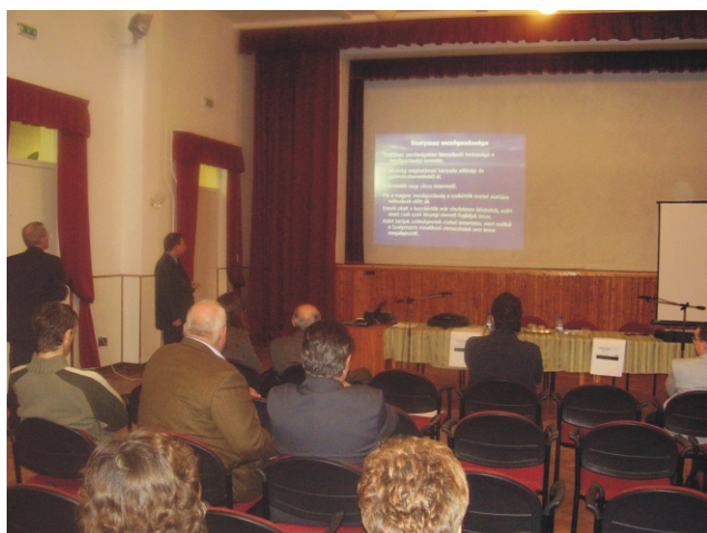
Domaszék és Szatymaz települések jövőképe projekt települési helyzetének bemutató fóruma