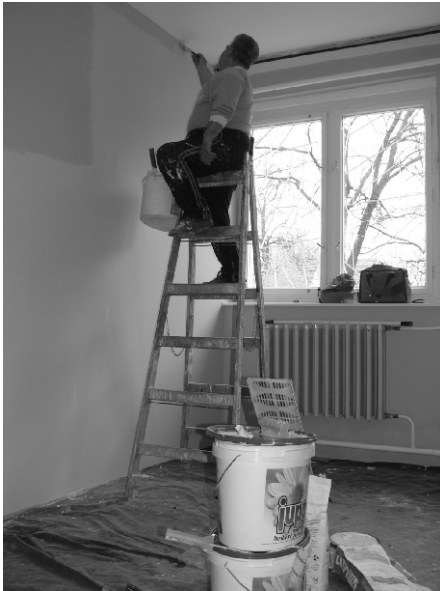
A festő „akció” közben