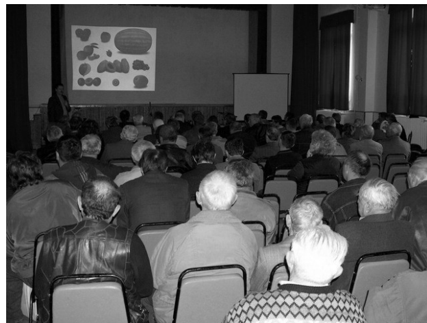
A szakmai előadások zsúfolásig megtelt teremben zajlottak