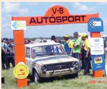
Pillanatképek a Szatymazdakarról