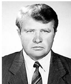
Kedves Kollégánkkal 8 évig dolgoztunk együtt az idősgondozásban.