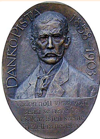
Dankó Pista Művelődési Ház és Könyvtár Szatymaz

"Keresd, művész, a magányt, Művet foganj s befejezz, De hogy élvezd alkotásod, Ahhoz társakat keress."