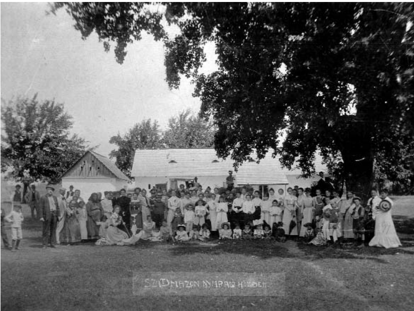
SZATYMAZON NYÁRFA HIBÉK