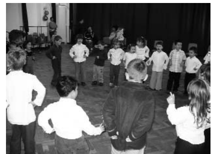
Mackó csoport salátakészítése az óvodában.

A "Mi Óvodánk Alapítványa Szatymaz" 2008. évi 1%-ból 221580 Ft bevételt kapott.