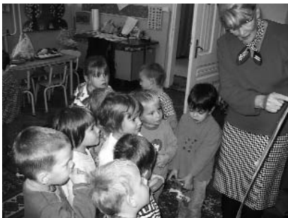
Egészségét keretében a Katica csoportban járt a fogorvos.