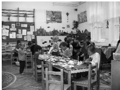
Anyatejes világnapon szerepelt a Mókusz csoport.