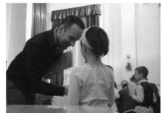
Járai Máté díjat ad át