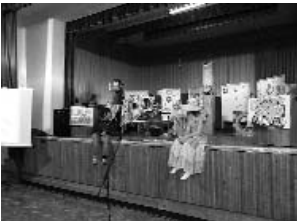
Kivirágzott a fánk fánk

December 4-én Szatymaz adott otthont a kis színészalánknak