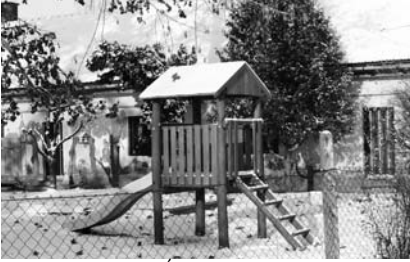
Az SZKTT Szatymazi Óvodájának udvarán új játékot, egy Ovivárat, vehettek birtokukba a legkisebbek, mely a Csongrád-megyei Önkormányzat Támogatásából valósult meg.

A hóeséssel Január nagy örömet hozott az óvodás gyermekeknek.