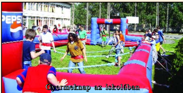
Gyermeknap az iskolában