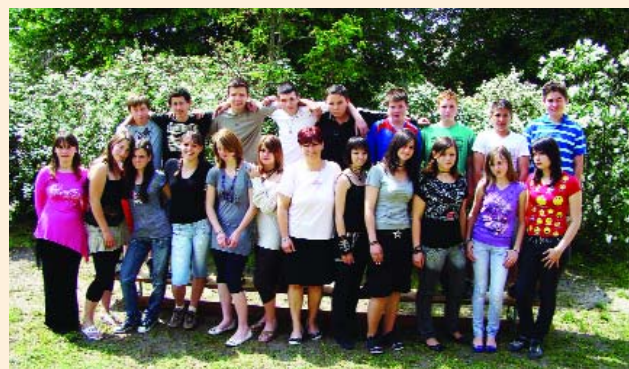
A "vén" diákok osztályfőnökeikkel a 8. a.-ból és a 8. b.-ből.