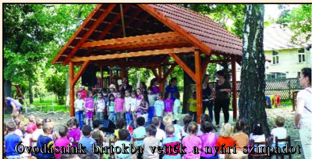
Óvodásaink birtokba vették a nyári színpadot