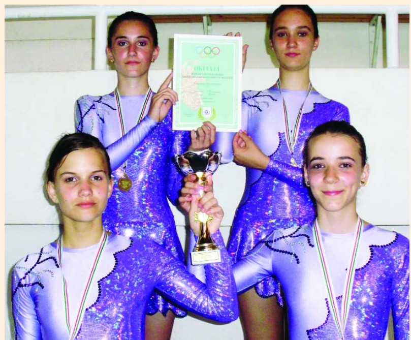
Magyar Köztársaság Diákolimpia bajnokai