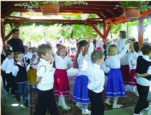
Ovodai évváró ünnepség