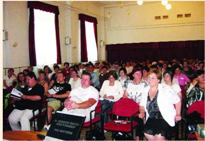
38. Csongrád Megyei Könyvtárosnap résztvevői Bővebben a következő lapszámunkban