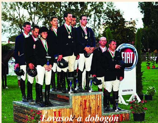
Lovasok a dobogón

A fotók közlését a következő számban folytatjuk