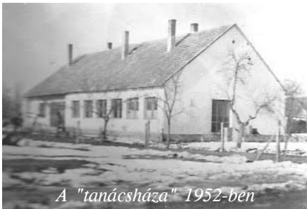
A "tanácsháza" 1952-ben

Bizony eltelt már annyi idő. Az időnként előkerülő sárgult iratok és fényképek, az egyre ritkuló özszejöveteleken olykor-olykor elhangzó mesének is beillő elbeszélések emlékeztetik a "régi" fiatalokat a község megalakulásának kezdeti, nem könnyű időszakára. Most megragadjuk az alkalmat, és az előkerült régi felvételek bemutatása kapcsán, visszaidézzük valamit a régmúltból, és bemutatjuk az önállóvá vált Szatymaz tanácsi dolgozóinak fellelt csoportképét. Azt már aligha kell megemlíteni, hiszen mindenki tudja, hogy a mai Szatymaz község területén a hajdani időkben, e-