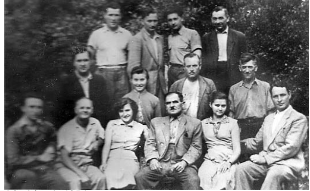
kép készült 1956

felsőbb vezetésnek is. A ezért elég gyorsan kialakult az a gyakorlat, hogy a ta-