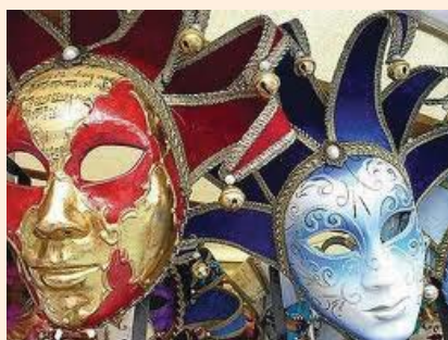
Indul a farsang

Jön a tavasz, megy a tél, barna medve üldögél: -Kibújás, vagy bebújás? Ez a gondom óriás!