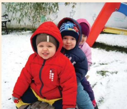
Akik örülnek a hónapnak