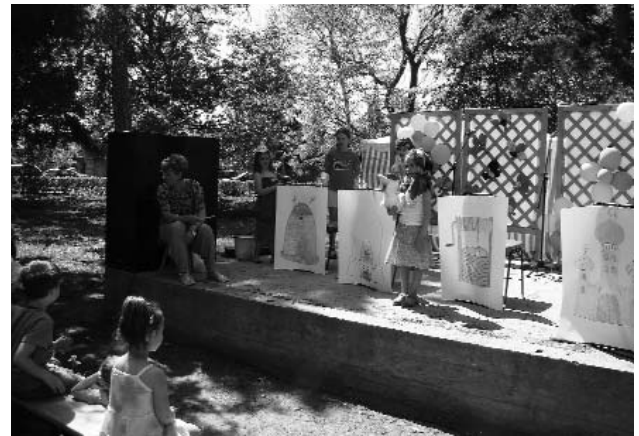
A Kiskakas gyémánt félkrajcárja dramatikus játék