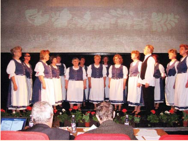
A négyszeres ARANY PÁVA díjas kórus

Amennyiben szeretnék, hogy újszülöttjük fotója megjelenjen a "Mi Lapunkban", kérjük, az adatokat küldjék el e-mailben a milapunk@szatymaz.hu címre, vagy személyesen hozzák el a szerkesztőségre.