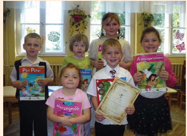
A szatymazi csapat