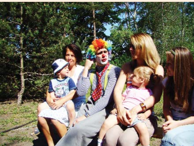
Bohóc műsor a Majálison