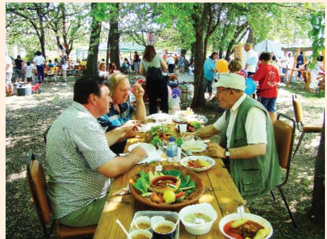
Munkában a zsűri

A szerkesztőség fenntartja magának a jogot, hogy a beküldött írásokat rövidítve, illetve szerkesztve közölje. Az újság az olvasók fóruma, a közölt levelek, cikkek tartalmával a szerkesztőség nem feltétlenül ért egyet.