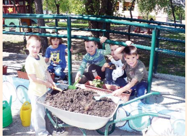
Virágosítás az óvodában