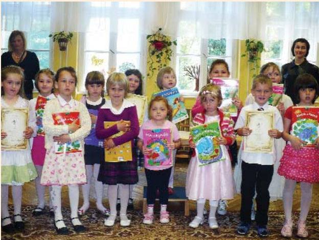
Dalospacsirta találkozó résztvevői