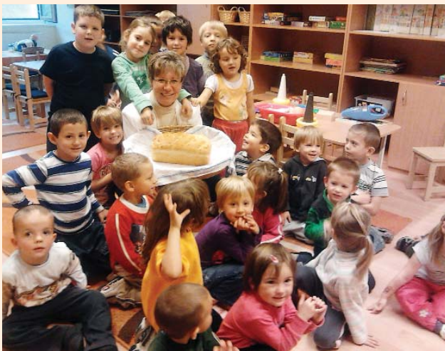
Kenyérsütés a Mókus csoportban