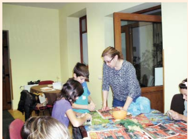
Foglalkozás a Napközis Táborban

A szerkesztőség fenntartja magának a jogot, hogy a beküldött írásokat rövidítve, illetve szerkesztve közölje. Az újság az olvasók fóruma, a közölt levelek, cikkek tartalmával a szerkesztőség nem feltétlenül ért egyet.