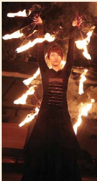
Kultúrparki advent: Flame Flowers tűzszonglőrök