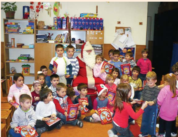
Óvoda: Mikulás a Katica csoportban

A szerkesztőség fenntartja magának a jogot, hogy a beküldött írásokat rövidítve, illetve szerkesztve közölje. Az újság az olvasók fóruma, a közölt levelek, cikkek tartalmával a szerkesztőség nem feltétlenül ért egyet.