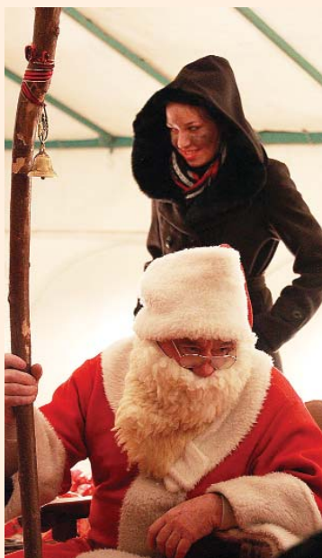
A Kultúrparki adventen is megajándékozta a gyermekeket a mikulás