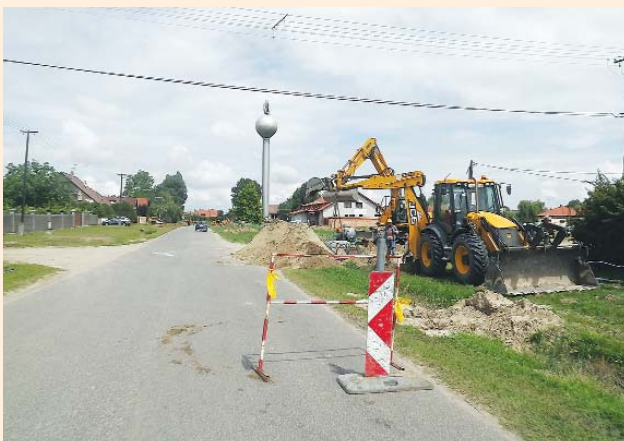
Csatornázás Szatymazon (cikk a 3. oldalon)