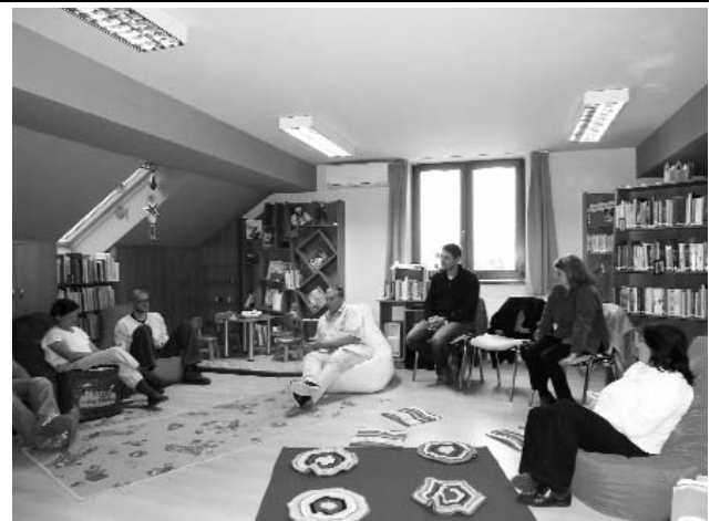
Közös beszélgetés a szatymazi Rehabilitációs Központ életéről 2013.május 23-án a könyvtárban

A projekt az Európai Unió támogatásával, az Európai Regionális Fejlesztési Alap társfinanszírozásával valósul meg.