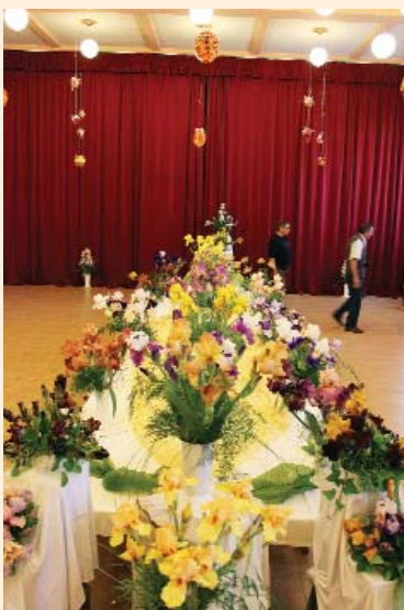
Írisz kiállítás a Faluházban