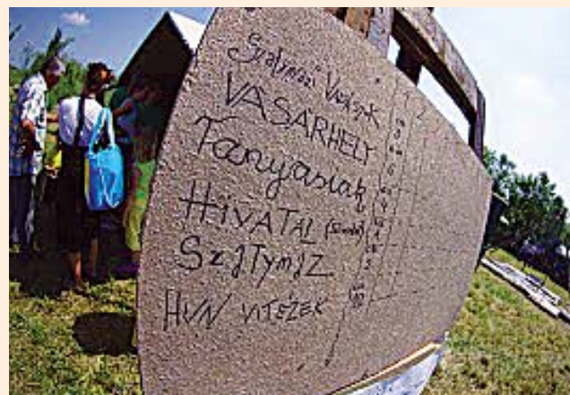
Kiállták a csapatok a Tanyasi 10 próbát (cikk a 9. oldalon)