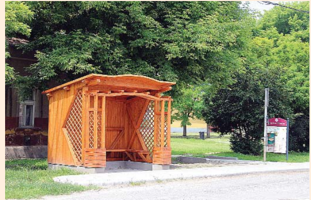
Az önerőből felújított vasútállomás előtti buszmegállóhely