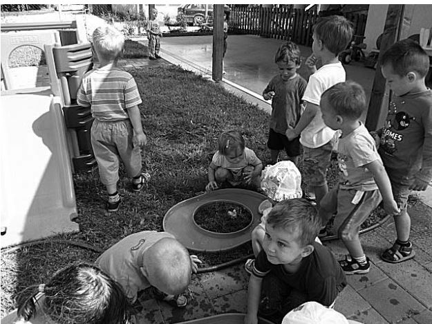
A meleg idő beköszöntével a gyerekek szívesen pancsolnak az udvaron.