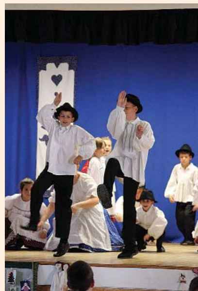
Fellépés a Bugaci Falunapon