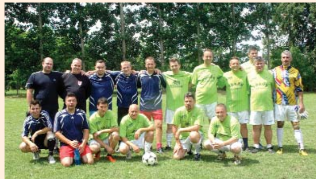
„Szatymazi sikerek a közelmúltból” Zombói Falunap: önkormányzati futballkupa (cikk: 4. oldal)