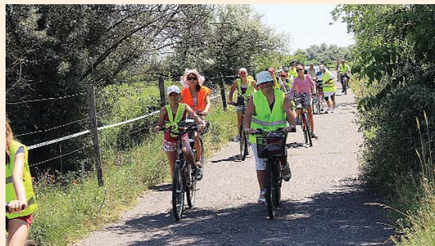
Biciklis kirándulás a Fehértóhoz

A szerkesztőség fenntartja magának a jogot, hogy a beküldött írásokat rövidítve, illetve szerkesztve közölje. Az újság az olvasók fóruma, a közölt levelek, cikkek tartalmával a szerkesztőség nem feltétlenül ért egyet.