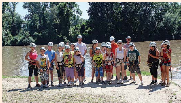
Makó Kalandparkban a „nagyokkal”