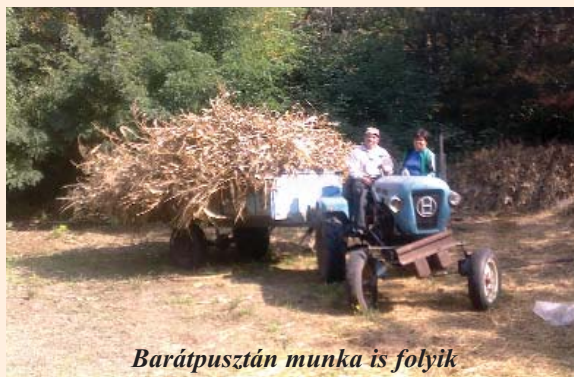
Barátpusztán munka is folyik

Amennyiben szeretnék, hogy újszülöttjük fotója megjelenjen a „Mi Lapunkban”, kérjük, az adatokat és a képet küldjék el a milapunk@szatymaz.hu -ra, vagy hozzák be személyesen a szerkesztőségbe!