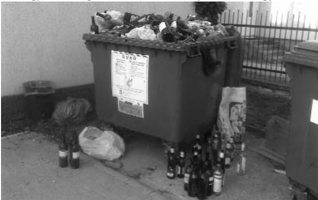
Ezért üresek a kocsmák: mindenki otthon iszik...!