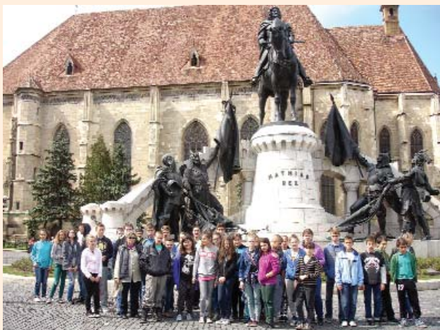
Szatymazi általános iskolások Kolozsváron, Mátyás király szobránál