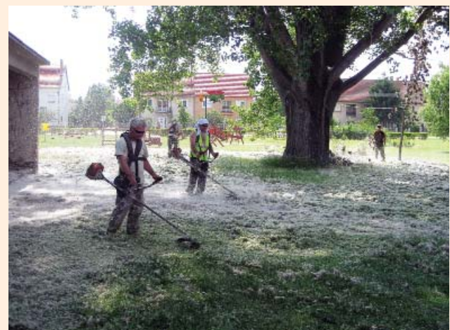
Közmunkások „hóesésben” a Faluház mögött

JÚLIUS 4. PÉNTEKEN 6-KOR A TÖRPI ELŐTT!!!