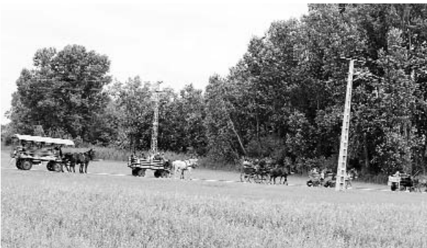
Vonulnak a fogatosok