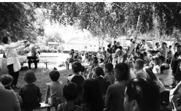
Bábelőadás a fák között