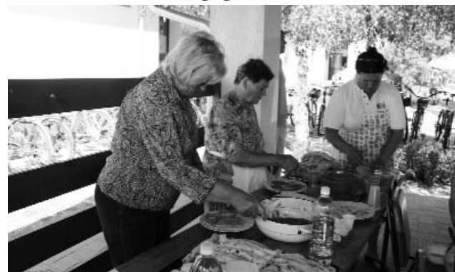
Rendületlenül készül a palacsinta