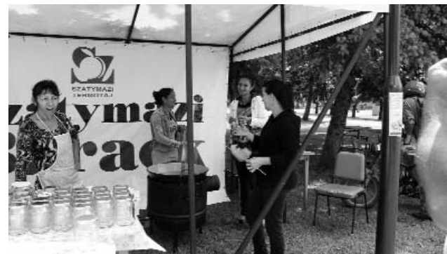
Két napig kavarták