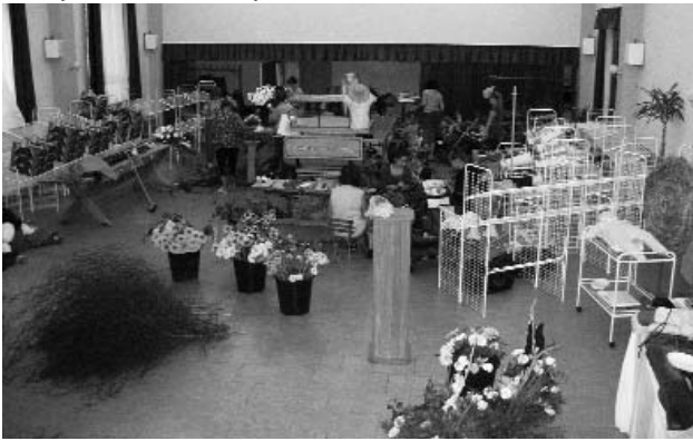
Készül a nagyterem