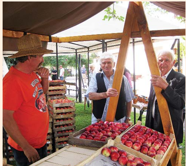
Termelők egymás közt a falunapon