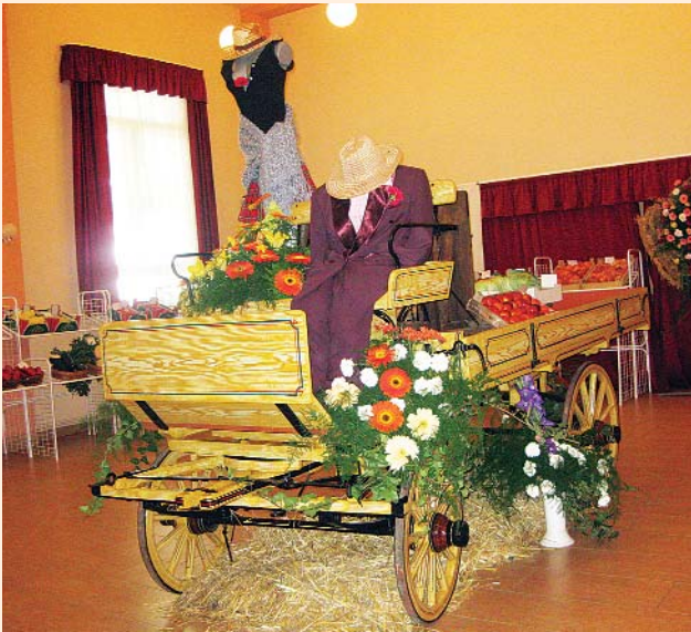
Részlet a falunapi virágkompozícióból