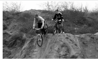
Megjelentek a bringások a víztorony melletti téren bedepózott homokon