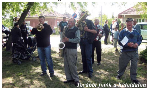
További fotók a hátoldalon