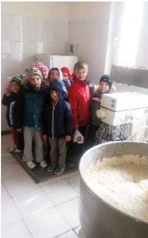
Hány kiló a Tavaszi tábor? Látogatás a Hodács pékségben

Első nap ellátogattunk a Hodács Pékségbe és megtudtuk hogyan készülnek a finom, foszlós kenyerek, péksütemények, sütemények. Nagy élmény volt látni, hogy a pult mögött hogyan dagasztják, keverik a tésztát. A gyerekek a mérlegre is ráállhattak, pont ráfért a kis csapat.