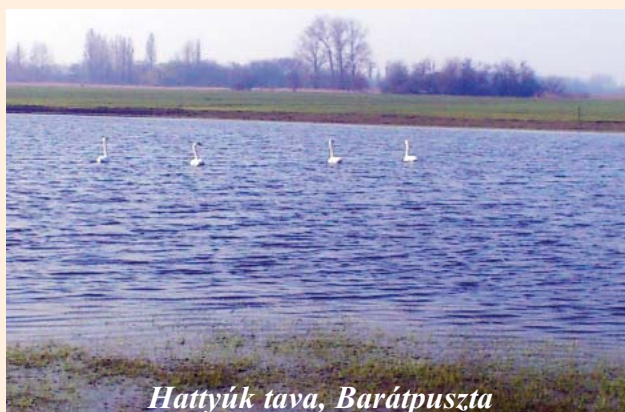
Hattyúk tava, Barátpuszta

Amennyiben szeretnék, hogy újszülöttjük fotója megjelenjen a „Mi Lapunkban”, kérjük, az adatokat és a képet küldjék el a milapunk@szatymaz.hu -ra, vagy hozzák be személyesen a szerkesztőségbe!