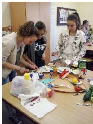
Csapatunk remekül szerepeltek, holtversenyben első