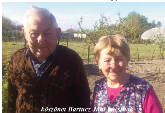
köszönet Bartucz Jánosnak