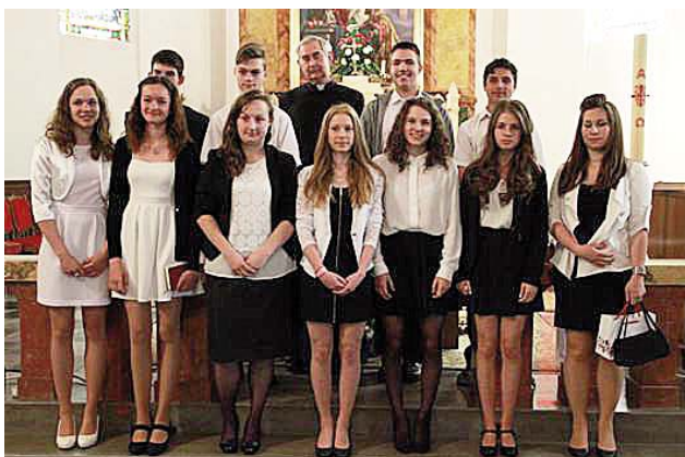
Bakos Brigitta fotói