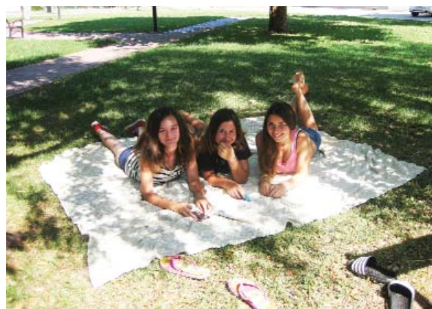
Ezt a kellemes látványt a Faluház előtti szabad internetkapcsolatnak – FreeWifi – köszönhetjük!