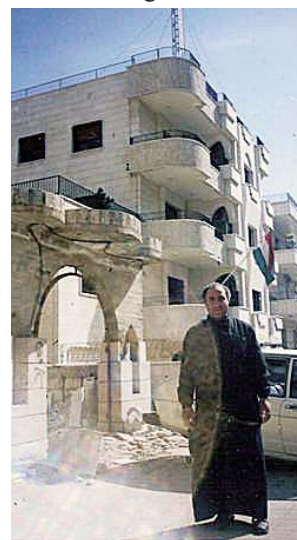
A damaszkuszi Magyar Nagykövetség előtt