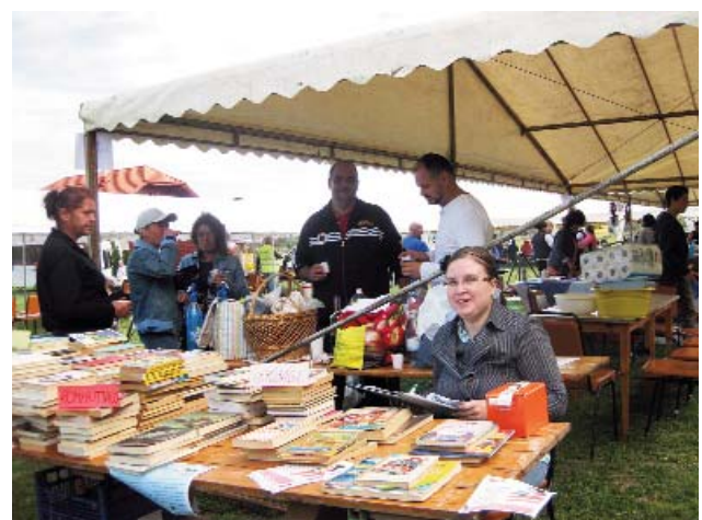
Olcso könyvekkel települt ki a Könyvtár a Repülónapra