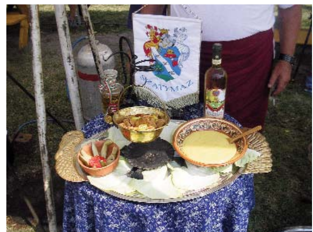
Augusztus 16., Zákányszék, főzőverseny, a Fakanál klub menüje: sertés lapocka pörkölt puliszkával