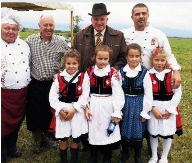
Ismét a Gyergyószárhegyi Gyermekeotthonban járt a Fakanál klub