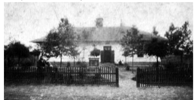
Az akkor felépült négy iskola közül a Győriszéki iskolában a tanítás 1854. október 1-vel indult. Avatás-