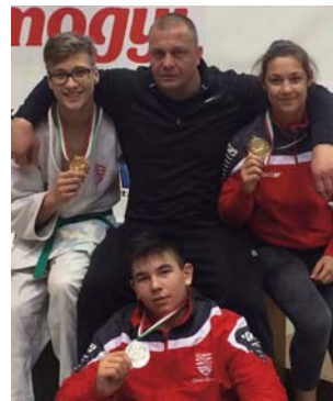
Nemzetközi Serdülő Válogatóverseny, Baja