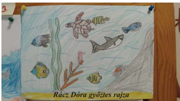
Rác, Dóra győztes rajza