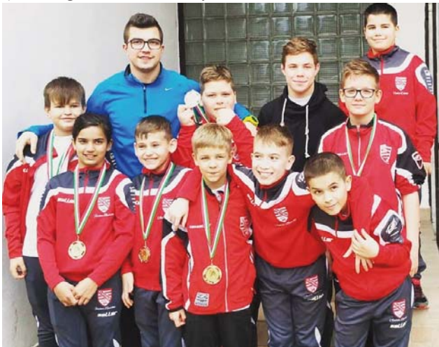
Solt Kupa, Solt

Március 19-én Baján Nemzetközi Serdülő Válogatóversenyt rendeztek, ahol a Szatymazi SE az éremtáblázat igen előkelő 4. helyén végzett, köszönhetően a 3 igéncsak eredményes indulójának: