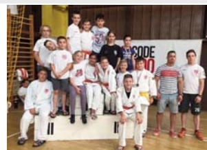
Diákolimpia, Cegléd (05.28.)