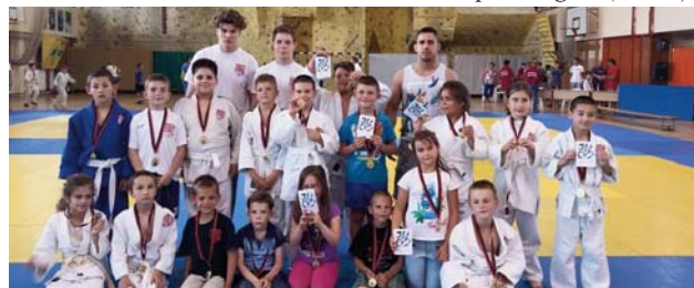
Kezdő judokáknak küzdelmi vetélkedő, Kecskemét (05. 29.)