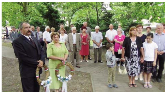
áldozás szentségében. Régióta nem láthattunk ilyen

Plébániánk és katolikus közösségünk eseményekben gazdag májust tud magamögött.