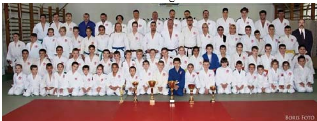
A Szatymazi SE Judo Szakosztálya. A kezdők (kicsik, felnőttek) az első sikeres övvizsga után (05.15.)

Május 15-én fehéröv-vizsga volt Szatymazon, ahol kezdő gyerek és felnőtt judósaink adtak számot elméleti és gyakorlati cselgáncstudásukról, kiérdemelve ezzel a fehér öv viselésének jogát. Gratulálunk!