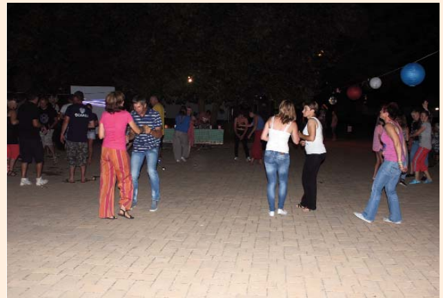
Első nőegyleti házibuli „Nyáresti risza”