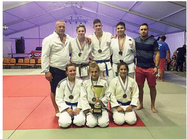
Szatymaz aranyérmes serdülő-ifi csapata - I. Őszibarack Nemzetközi Judo Fesztivál, Szatymaz