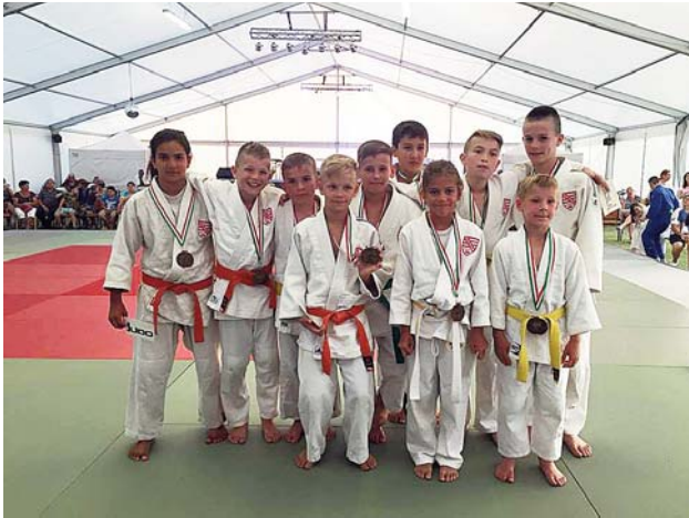
Szatymaz aranyérmes diák csapata - I. Őszibarack Nemzetközi Judo Fesztivál, Szatymaz

A Szatymazi Falunapok rendezvénysorozat keretében került megrendezésre július 8-án délután az I. Őszibarack Nemzetközi Judo Fesztivál, ahol fantasztikus hangulatban ismerkedhetett a falu aprajánagyja ezzel az egyre nagyobb népszerűségnek ör-