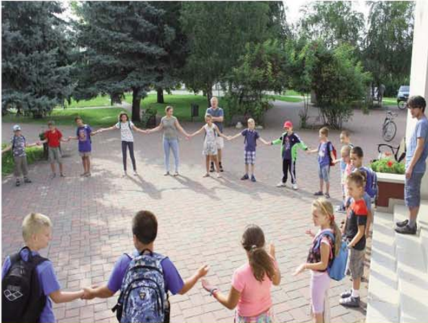
Az első nap - buszra szálló