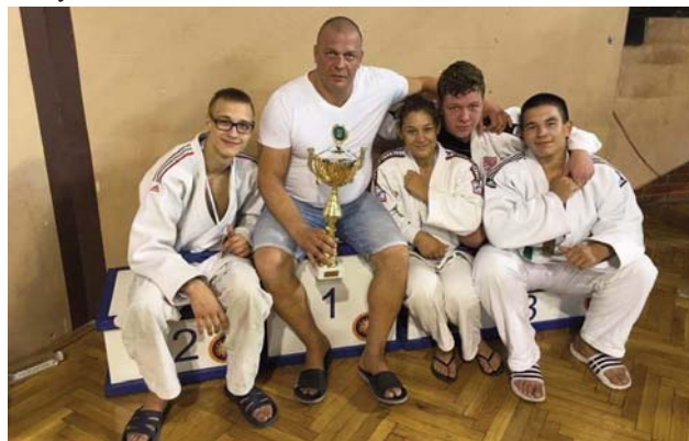
Összetett csapatverseny I. helyezés - Euro Liga II. forduló, Szabadka, Szerbia