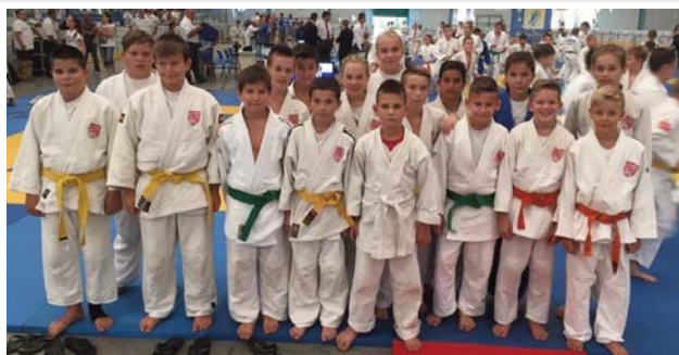
Euro Liga III. forduló, Szeged

Az Euro Liga összetett csapatverseny: I. helyezett Szatymaz!