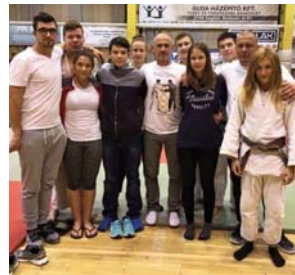
Ifjúsági B OB, Cegléd (2016.10.22.)