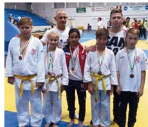
Diák B OB és CSB, Kecskemét (2016.10.08.)