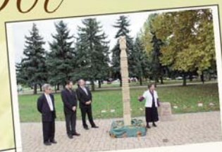
Október 23. Kopjafelállítás