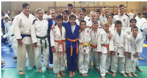
XIX. Nemzetközi Judo Kupa és IX. Zeljko Nikolic Emlékverseny, Obecse, Szerbia (2016.10.02.)