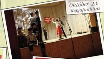
Október A szat