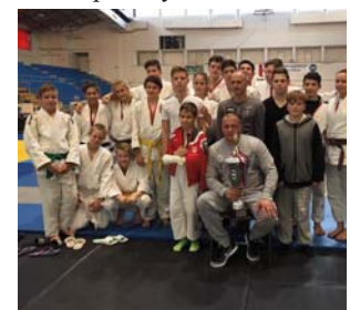
Zsoldos Zsolt Emlékverseny, Szentkirályi Kupa, Kecskemét (2016.10.30.)