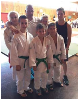
Diák A OB és CSB, Siklós (2016.10.01.)