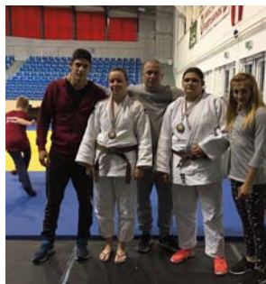
Felnőtt OB, Kecskemét (2016.10.29.)

Október 16-án Győrszentiván adott otthont a Serdülő B és Junior B Országos Bajnokságnak, ahol bronzérmes