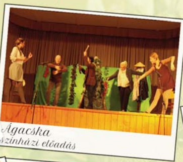
Agacska színházi előadás