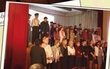
Október 23. A szatymazi általános iskola előadása

A szerkesztőség fenntartja magának a jogot, hogy a beküldött írásokat rövidítve, illetve szerkesztve közölje. Az újság az olvasók fóruma, a közölt levelek, cikkek tartalmával a szerkesztőség nem feltétlenül ért egyet.