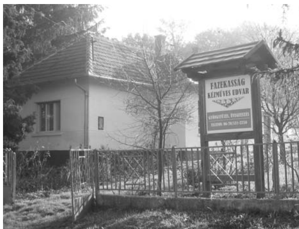
A zselicai falusi bemutató porták egyike Bánya településen