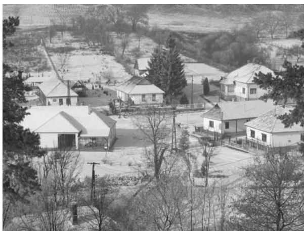
A falusi turizmus fogadó épületei Irotán