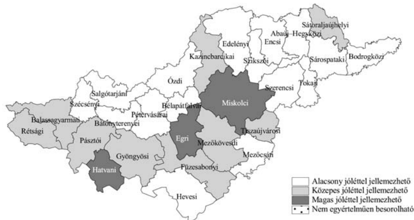
3. ábra: Az Észak-Magyarországi Régió jövéli helyzete kistérségi aggregációs szinten (2008)