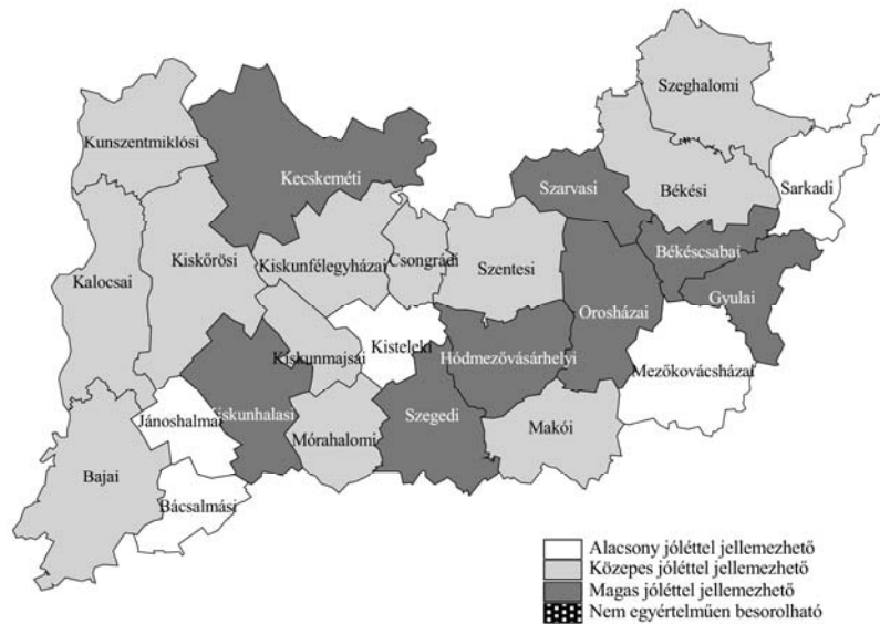
3. ábra: A Dél-alföldi Régió jövéli helyzete kistérségi aggregációs szinten (2008)

helyzeténél. A Dél-alföldi Régióban (2. ábra) ugyanis a Régióhoz tartozó kistérségeknek csupán 20%-a (Bácsalmási, Jánoshalmi, Kisteleki, Mezőkovácsházai és Sarkadi) jellemezhető relative alacsony jövével, míg a Régió kistérségeinek mintegy egyharmadára magas jövével jellemző. Ehhez képest az Észak-Magyarországi Régió kistérségeinek (3. ábra) többsége (a 28-ból 16 kistérség) tartozik az alacsony jövével jellemezhető kategóriába, és pusztán a kistérségek alig több, mint 10%-a (3 kistérség) a magas jövével jellemezhetőbe.