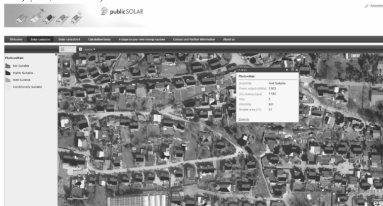
1.a ábra: A publicSOLAR által kifejlesztett solárkataszter Forrás: http://publicsolar.ipsyscon.com .

A távérzékelési és a térinformatikai módszerek fejlődésével és azok alkalmazásával olyan elemzési és digitális megjelenítési lehetőségek alakultak ki, melyek lehetővé teszik a nagy részletességű és pontosságú adatbázisok létrehozását. A fejlett, nyugati országokban (Amerikai Egyesült Államok, Németország, Nagy-Britannia, Ausztria) a 90-es évek végén kezdődött el különböző térinformatikai módszerekkel a tető- illetve később solárkataszterek létrehozása, kialakítása települési, kistérségi, valamint egyes országokban tartományi szinteken (POLIS – project, Wien - Solarpotenzial-kataster, Enbausa által német, osztrák, svájci települések – enbausa.de, stb.) (1.a, 1.b ábra).