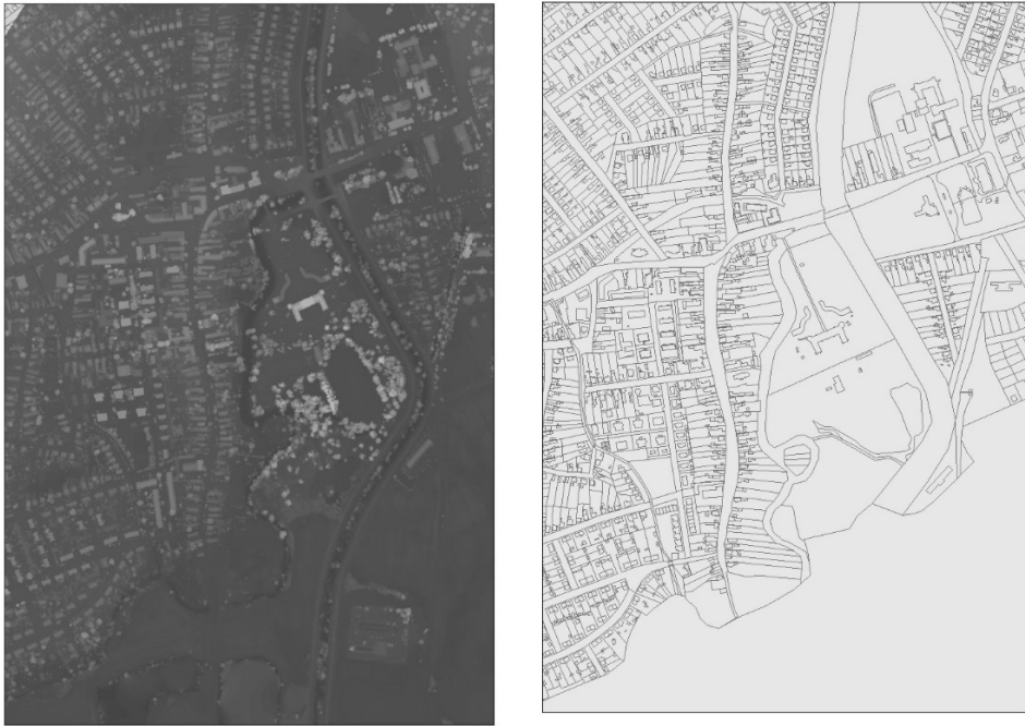
4.ábra: Az elkészült digitális felszín modell (DSM) és a kataszteri térkép (edelési részlet)

Miután a 3D-s városmodellek elkészültek és vizsgálhatóvá váltak, a korábban említett SolarRadiation modullal a besugárzási adatokat számítom ki. Itt fontos elemnek tartom, az árnyékoltság vizsgálatot, mely a tetőkön megtalálható különböző tárgyak (kémény, parabola antenna, stb.) valamint építészeti megoldások (kiszögellések, tetőablakok, stb.) miatt fontos elvégezni, ugyanis ezek is jelentősen befolyásolhatják a direkt besugárzást ezáltal a megtermelhető energia mennyiségét. Másik fontos lépés még a tető felületeken a potenciális hely kiválasztása, ahová építhető, felszerelhető egy-egy napelemes/napkollektoros rendszer. A tetőfelületek határvonalától számított 0,75-1 m-es területet felszerelésre nem alkalmas területek kell nyilvánítani, építészeti és gépészeti követelmények miatt. Harmadik besugárzást befolyásoló tényező vizsgálatánál még az épületek közvetlen környezetében elhelyezkedő növényzetet vizsgálom meg, azon belül is az adott növényzet árnyékvetésének nagyságát. Érdekes/mes iránynak tartom még továbbá a vizsgálatát annak, hogy a villamos közmű hálózattól milyen távolságra helyezkednek el egyes objektumok, azok milyen funkciót töltenek be így tervezhetővé válik az autonóm épületegyüttesek kialakítása, megmondolása.