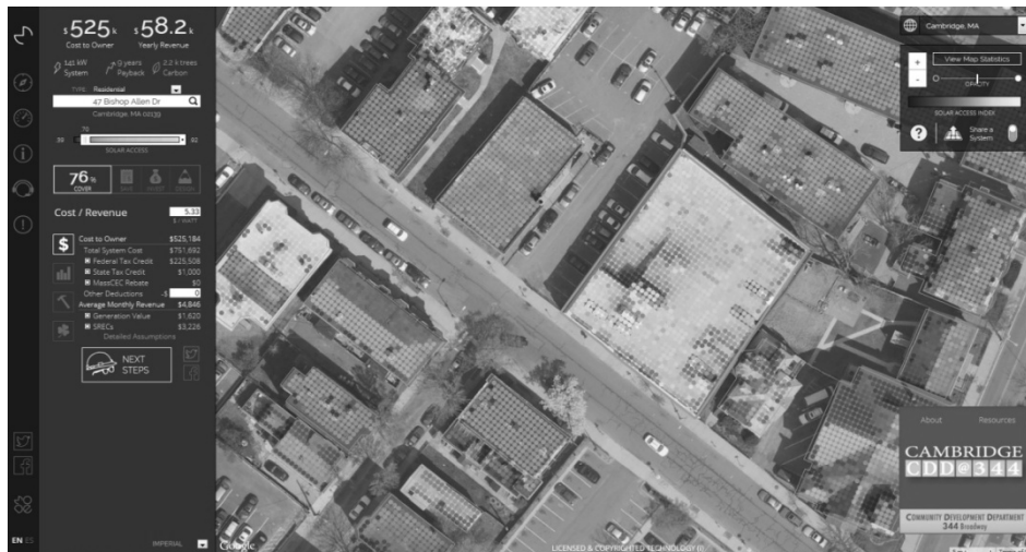
1.b ábra: A Massachusetts Institute of Technology (M.I.T.) - Mapdwell LLC által kifejlesztett Mapdwell Solar System